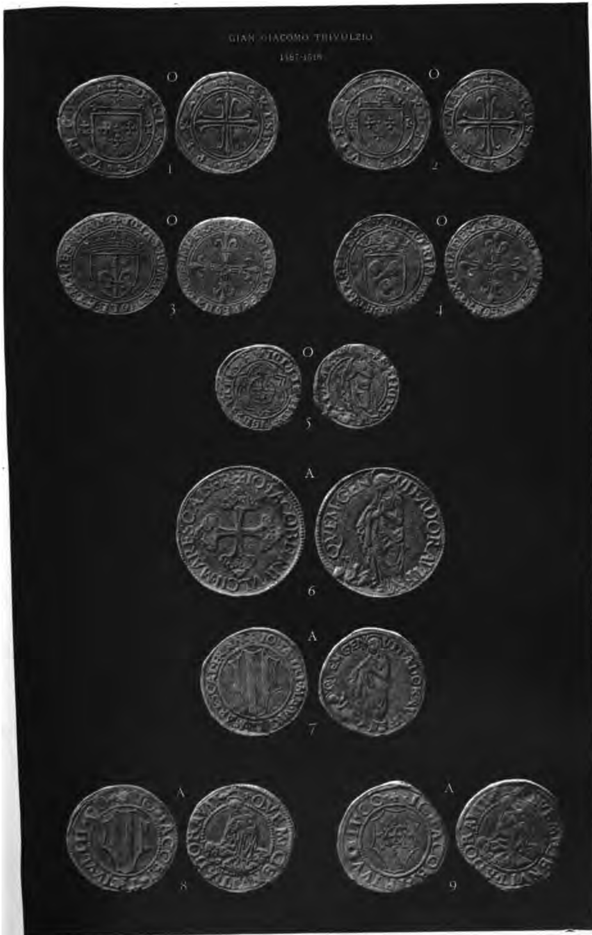
V. TURATI, Milano.