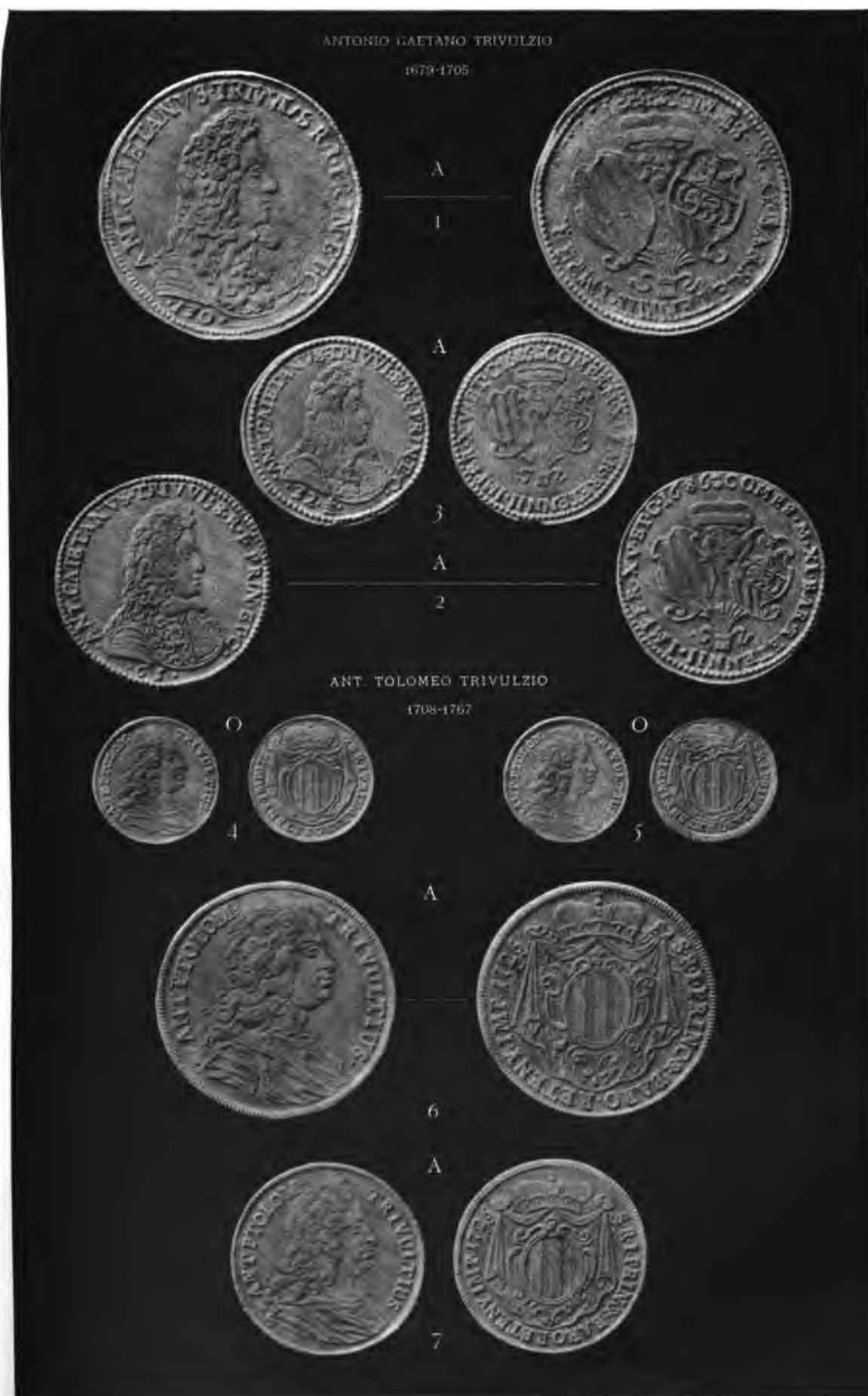
V. TURATI, Milano.