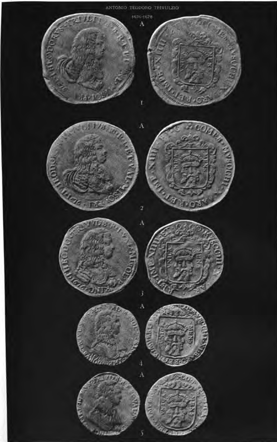
V. TURATI, Milano.