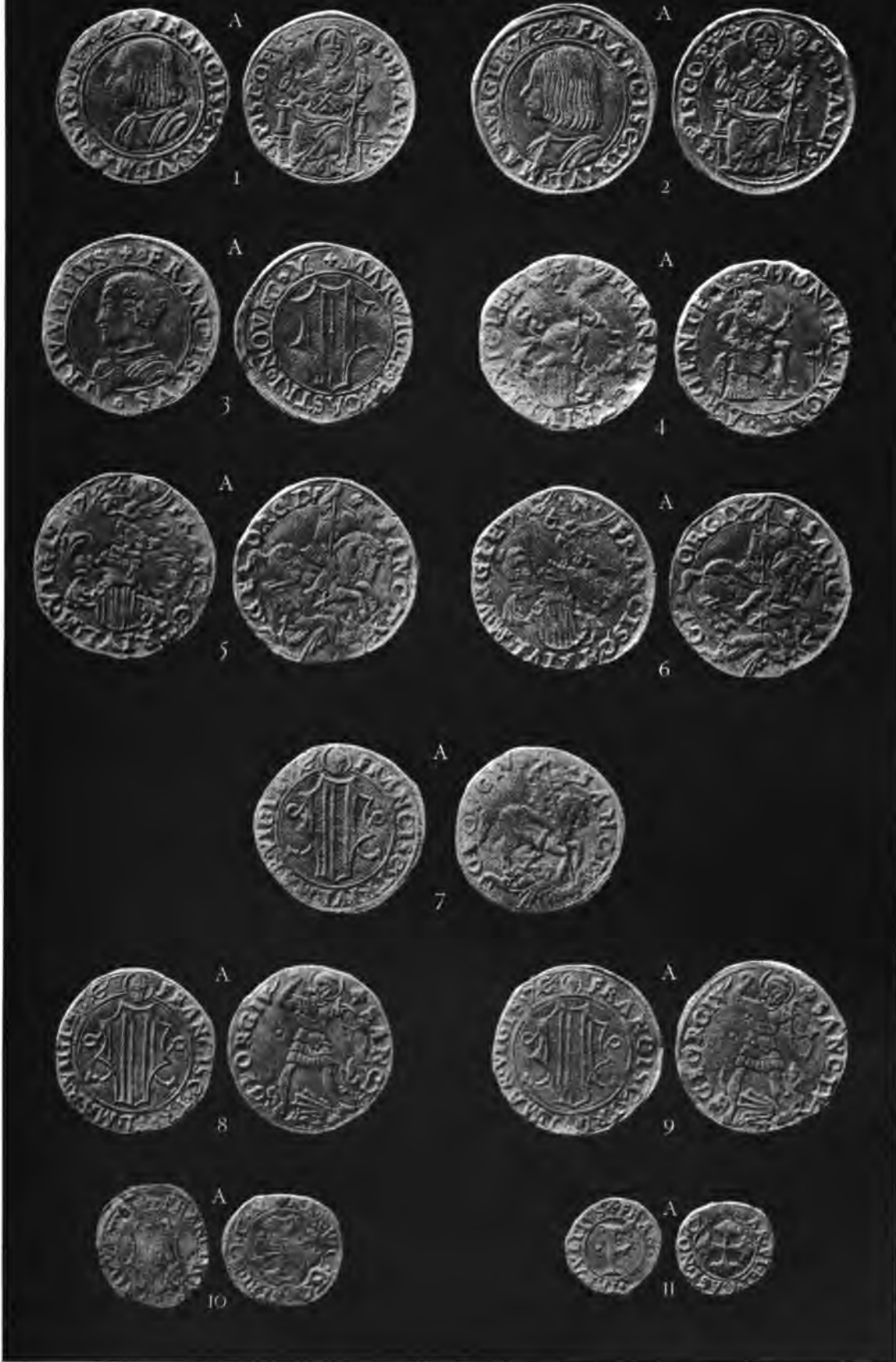
V. TURATI, Milano.