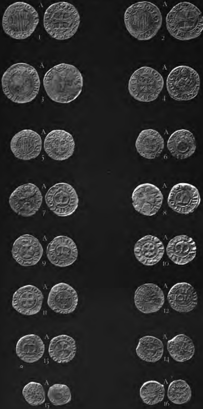
V. TURATI, Milano.